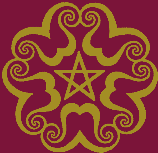
Siegel des zweiten Mysteriendramas von Rudolf Steiner

Sonntag, 17. Juni 2012, 10.00 bis 17.00 Uhr