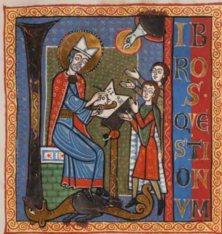
Gilbert von Poitiers

Alle Wochenend- und Tagesseminare können als Fortbildungsveranstaltung bescheinigt werden.